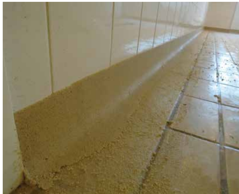
Arremates de cantos e rodapés

Aplicação da Membrana e do Primer em cantos e rodapés