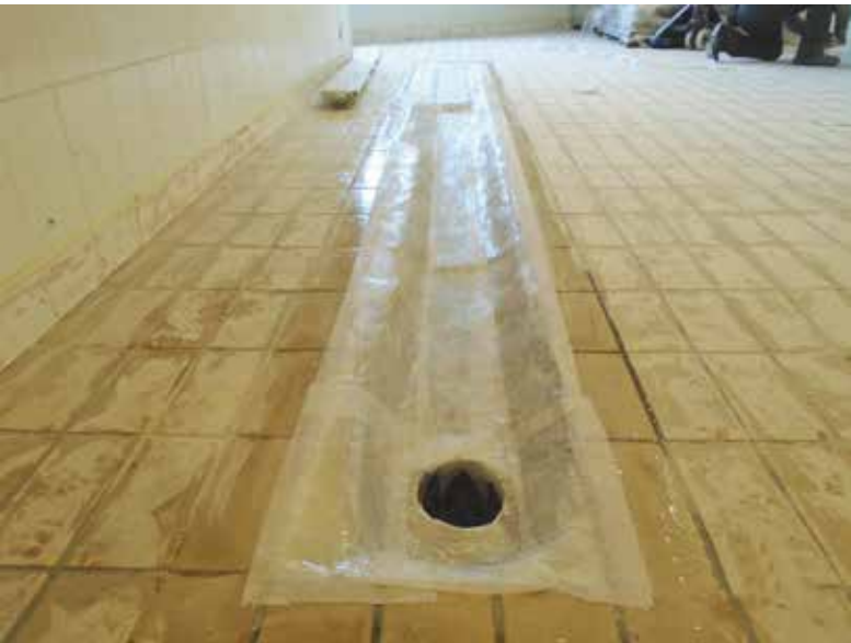
Duraline AN Saturado