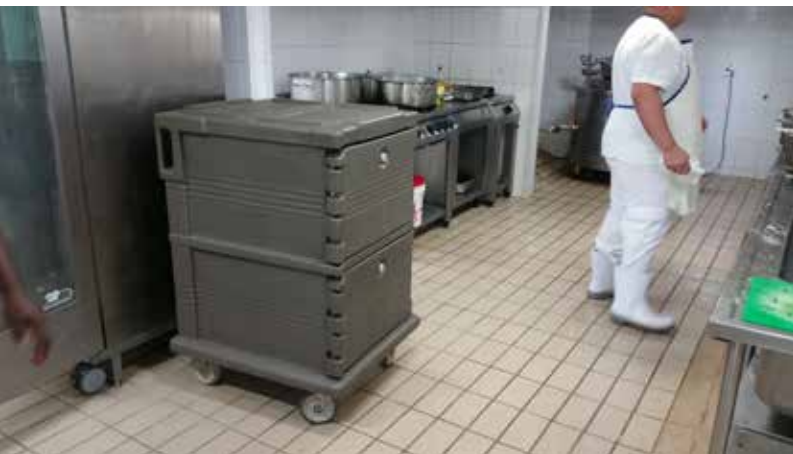
Duraline AN Saturado