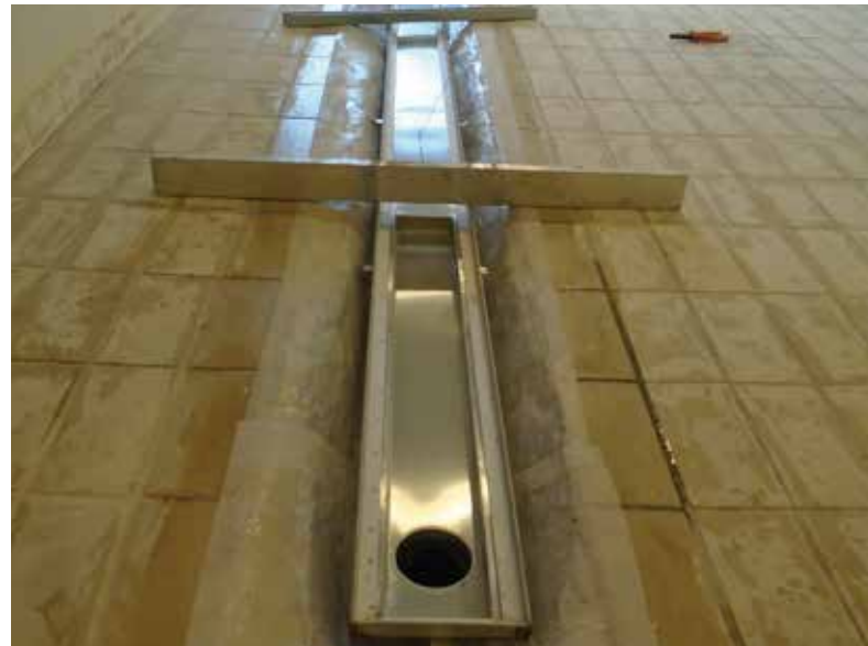
Aplicação da Membrana e instalação da canaleta