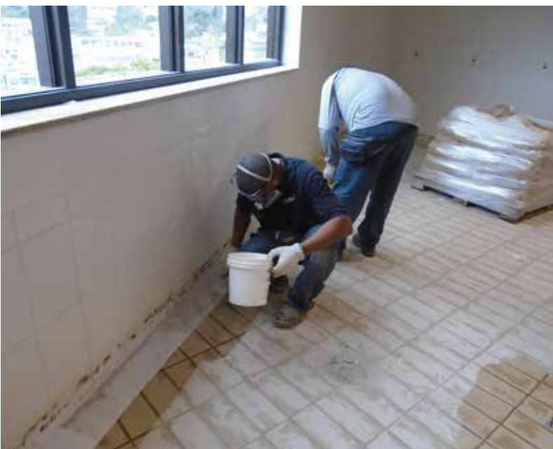
Duraline AN Saturado